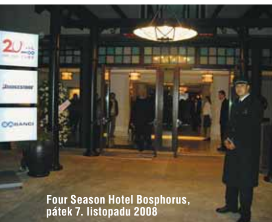
Four Season Hotel Bosphorus, pátek 7. listopadu 2008

V listopadu letošního roku uplynulo dvacet let od podepsání smlouvy o společném podniku na výrobu pneumatik mezi tureckou firmou Sabanci a japonským Bridgestonem. Pneumatikárna ve městě Izmit založená tureckým rodinným impériem Sabanci Group v té době fungovala již čtrnáct let, nicméně vstup japonského koncernu pro ni znamenal zásadní historický obrat.