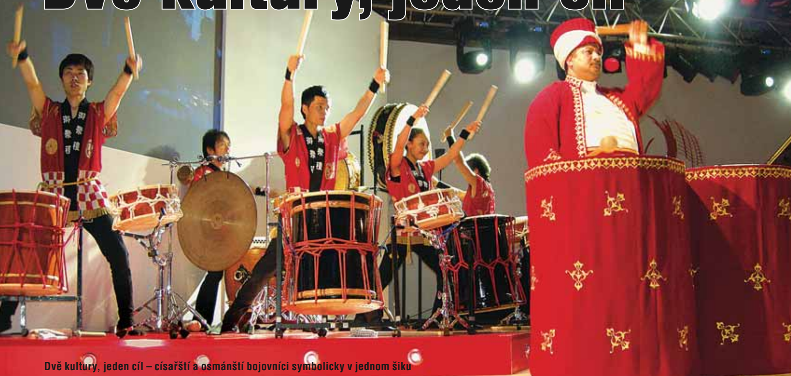
Dvě kultury, jeden cíl – císařští a osmánští bojovníci symbolicky v jednom šiku

V listopadu letošního roku uplynulo dvacet let od podepsání smlouvy o společném podniku na výrobu pneumatik mezi tureckou firmou Sabanci a japonským Bridgestonem. Pneumatikárna ve městě Izmit založená tureckým rodinným impériem Sabanci Group v té době fungovala již čtrnáct let, nicméně vstup japonského koncernu pro ni znamenal zásadní historický obrat.