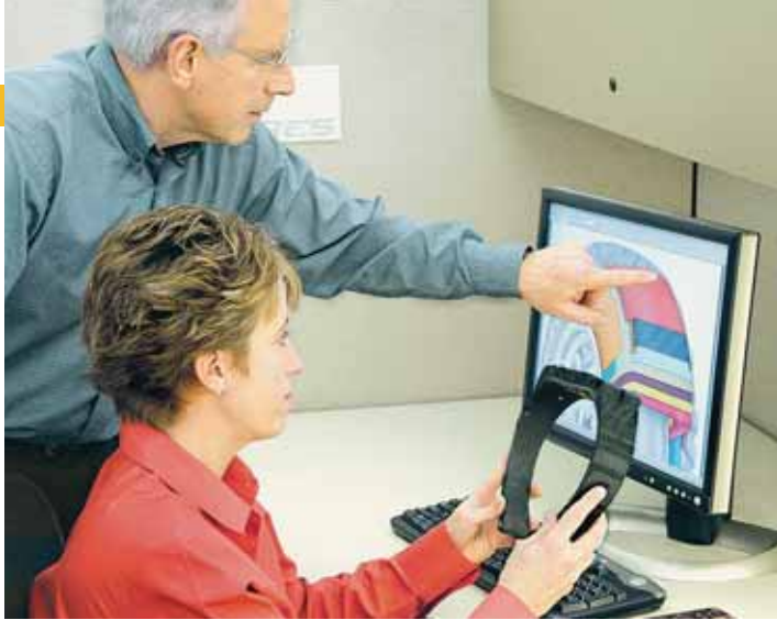
Výzkumná laboratoř společnosti Cooper/Avon

lýze. To je však obrovsky nákladné a také nespolehlivé, protože vývoj pneumatiky je nesmírně komplexní záležitost a nic tu nevzniká prostým součtem jedna a jedna. V každé továrně je také jiné strojní vybavení, které má na konečný produkt významný vliv. Vyrobit tedy dobrou repliku, ať už prostým okopírováním nebo s pomocí průmyslové špionáže, není zas tak jednoduché.