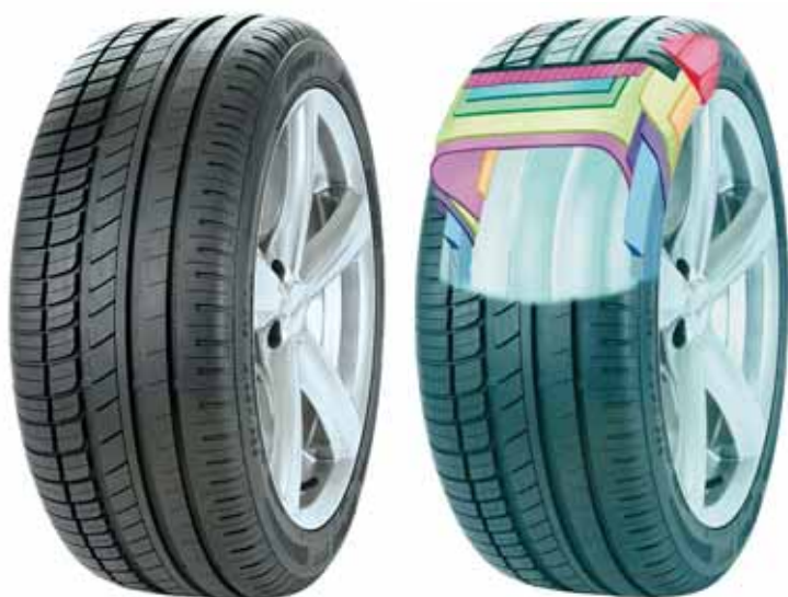
Dezén a řez novou pneumatikou Avon ZV5

96 % rozměrů v rychlostním indexu V. V sektoru W/X činí pak pokrytí jen dezénu ZV5 celých 72 %.