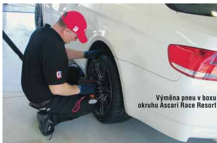
Výměna pneu v boxu okruhu Ascari Race Resort

Jak je patrné z grafu, oproti ZV3 se nová pneumatika posunula v rychlostním spektru o stupeň výš, což je ostatně společné pro všechny nové nástupce v produktové řadě Avon (viz CR 322, ZZ3). Velkou předností nového dezénu je široké rozměrové pokrytí v sektoru V – činí až 86% běžných evropských rozměrů, se započtením dezénu ZZ3 pak Avon pokrývá až