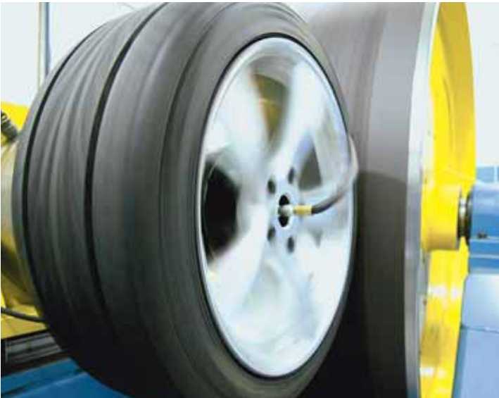
Výzkum a vývoj sídlí také v továrně, příští rok se má toto oddělení ještě posílit.

nou část obrátu pneumatiky motocyklové. V této skupině je pozice Avonu velmi silná, v některých zemích se podíl značky na trhu náhradní potřeby pohybuje i kolem 10 %. V sektoru osobních pneumatik je Avon rovněž výrobcem širokého rozměrového spektra od velkosériových cestovních pneu po vysokorychlostní pneumatiky. Avon nepomíjí ani pneumatiky pro lehčí užitková vozidla a pneu 4x4. Velice významnou komoditou jsou zimní pneumatiky, které Avon vyvíjí a vyrábí s ohledem na kontinentální evropské podmínky.