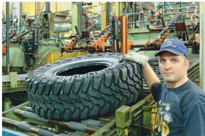
Výstupní kontrola zakončuje výrobní proces.

To, že Cooper relativně malé anglické výrobce v 90. letech ovládl, bylo vlastně velkým štěstím. Přežít v podmínkách skomírajícího domácího automobilového trhu