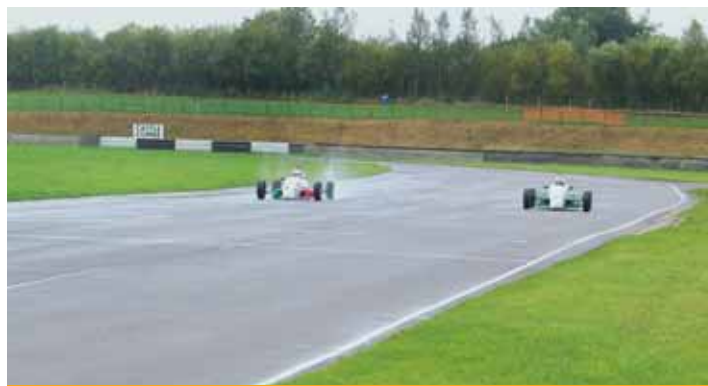
Jízda s formuli Ford na okruhu Castle Combe byla pro dealery jedinečným zážitkem.