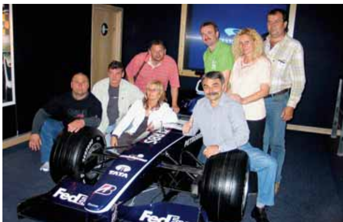
Společná fotografie z návštěvy stáje Williams F1