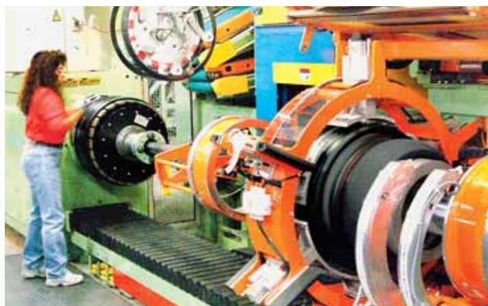
Na konfekčních strojích se připravují polotovary, které putují k vulkanizačním

jméno Opel, nýbrž Vauxhall, ale od svého německého sourozence se téměř v ničem neliší.